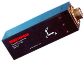
3-achsiges Fluxgate Magnetometer mit Analogausgang.